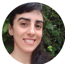
CAROLINA | BS AS Z.OESTE 🇦🇷