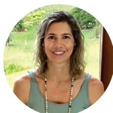
CLAU | COLOMBIA 🇨🇴

REPRESENTANTES DE LA ESCUELA EN DIFERENTES REGIONES