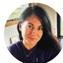
PATY | CHILE 🇨🇱