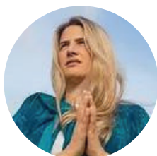
FLOR | URUGUAY 🇺🇾