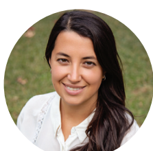
LUZ | BS AS Z.OESTE 🇦🇷