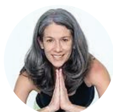
TITA | VENEZUELA 🇻🇪