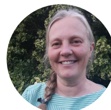
VALE | IRLANDA 🇮🇪